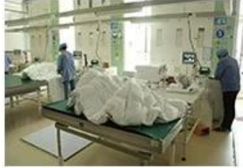
⑧ Product inspection