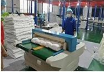
⑦ Needle detectors