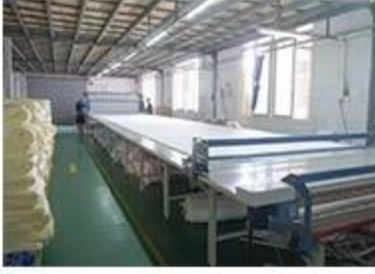
① Fabric inspection