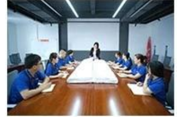
⑨ Finished product