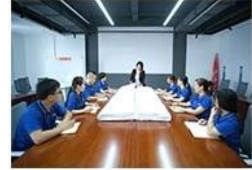
⑨ Finished product