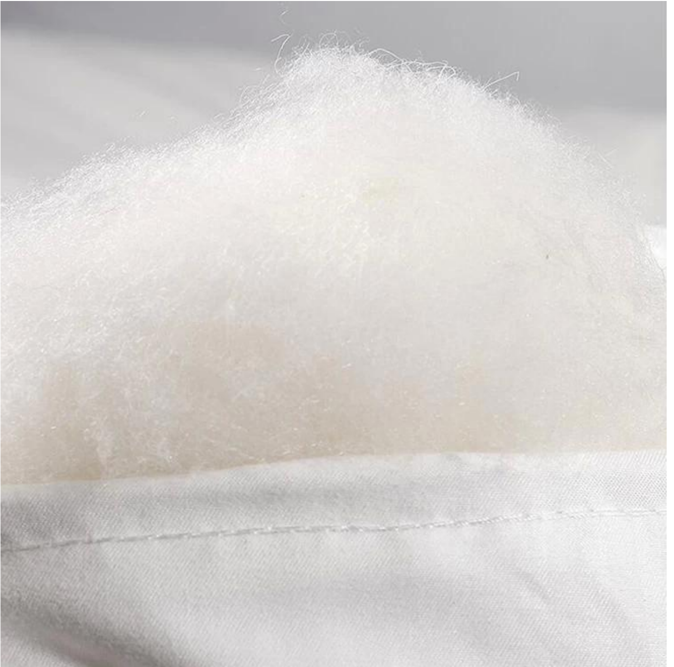
Figure 1: A close-up photograph of a white fabric with a large, fluffy, white tuft or pile of fibers protruding from the top surface. The fabric has a visible weave pattern and a horizontal seam or fold line near the bottom edge.