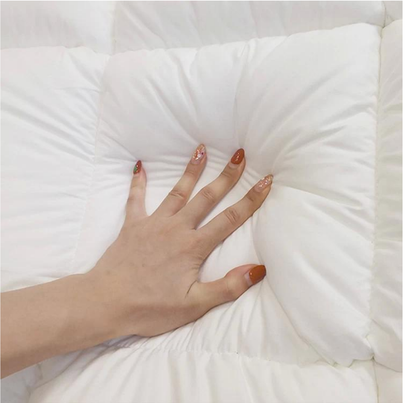
Figure 18: A hand with manicured nails resting on a white, quilted surface.