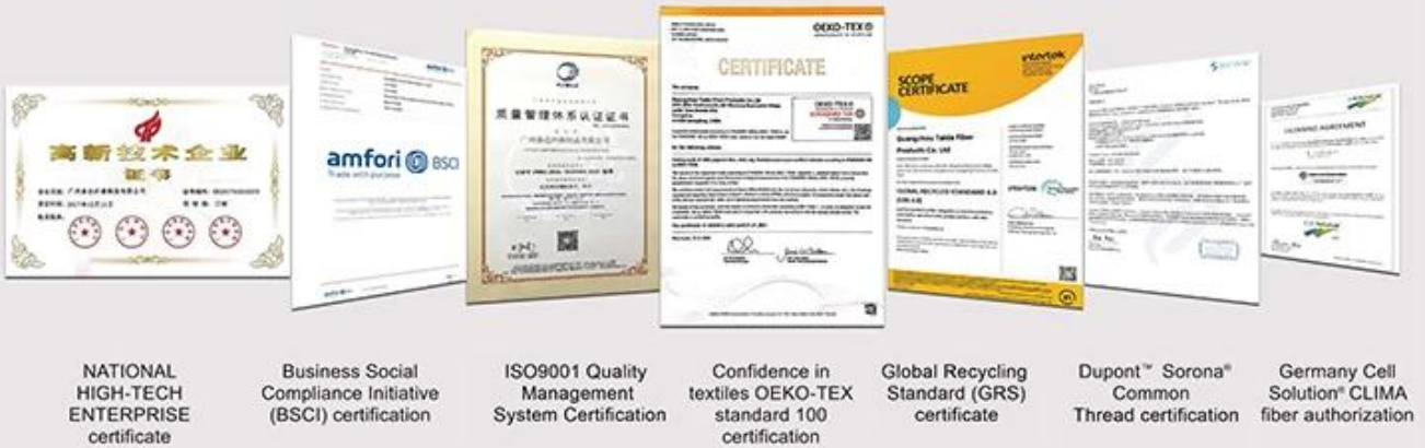
NATIONAL HIGH-TECH ENTERPRISE certificate