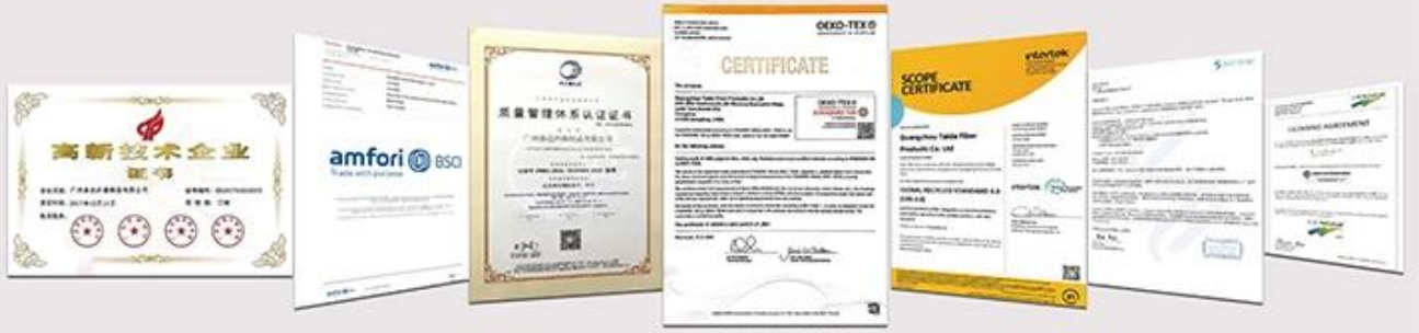
NATIONAL HIGH-TECH ENTERPRISE certificate Business Social Compliance Initiative (BSCI) certification ISO9001 Quality Management System Certification Confidence in textiles OEKO-TEX standard 100 certification Global Recycling Standard (GRS) certificate Dupont™ Sorona® Common Thread certification Germany Cell Solution® CLIMA fiber authorization