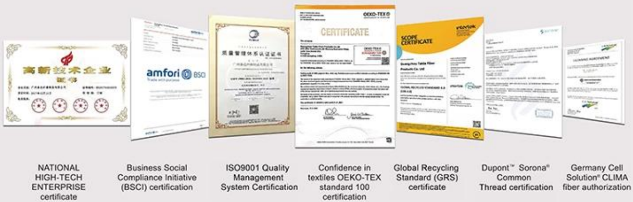
NATIONAL HIGH-TECH ENTERPRISE certificate