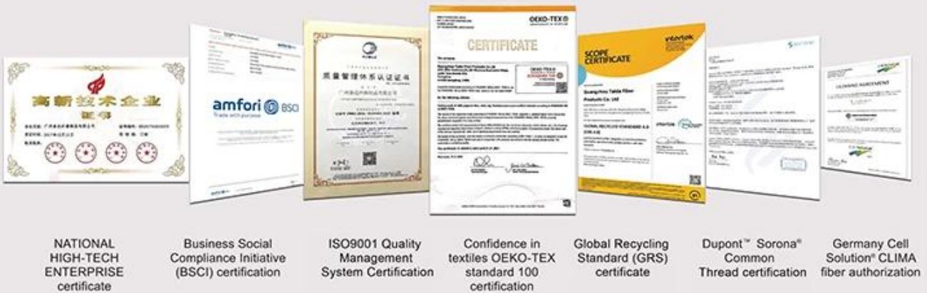
NATIONAL HIGH-TECH ENTERPRISE certificate