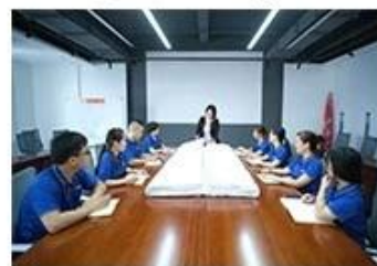
⑨ Finished product