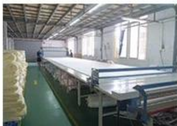
① Fabric inspection