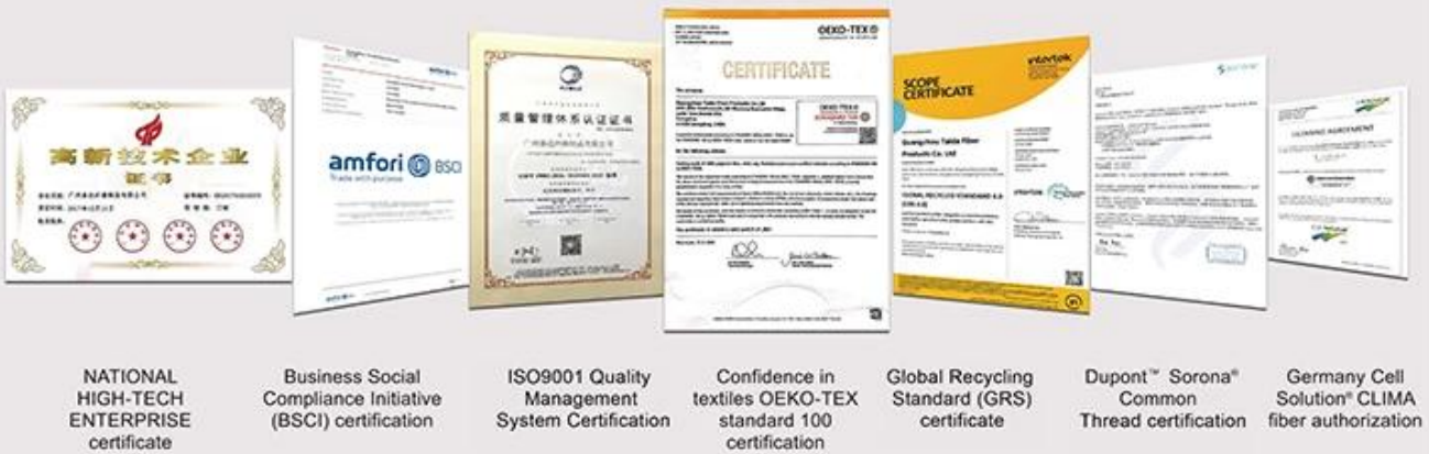
NATIONAL HIGH-TECH ENTERPRISE certificate