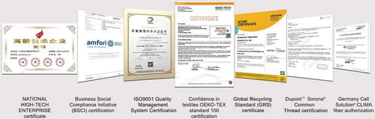
NATIONAL HIGH-TECH ENTERPRISE certificate