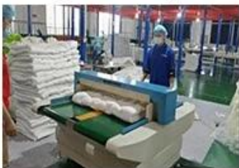
⑦ Needle detectors