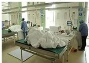
⑧ Product inspection