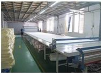
① Fabric inspection