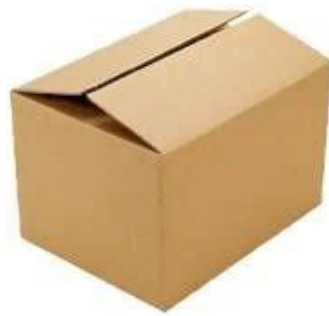
Large parper carton