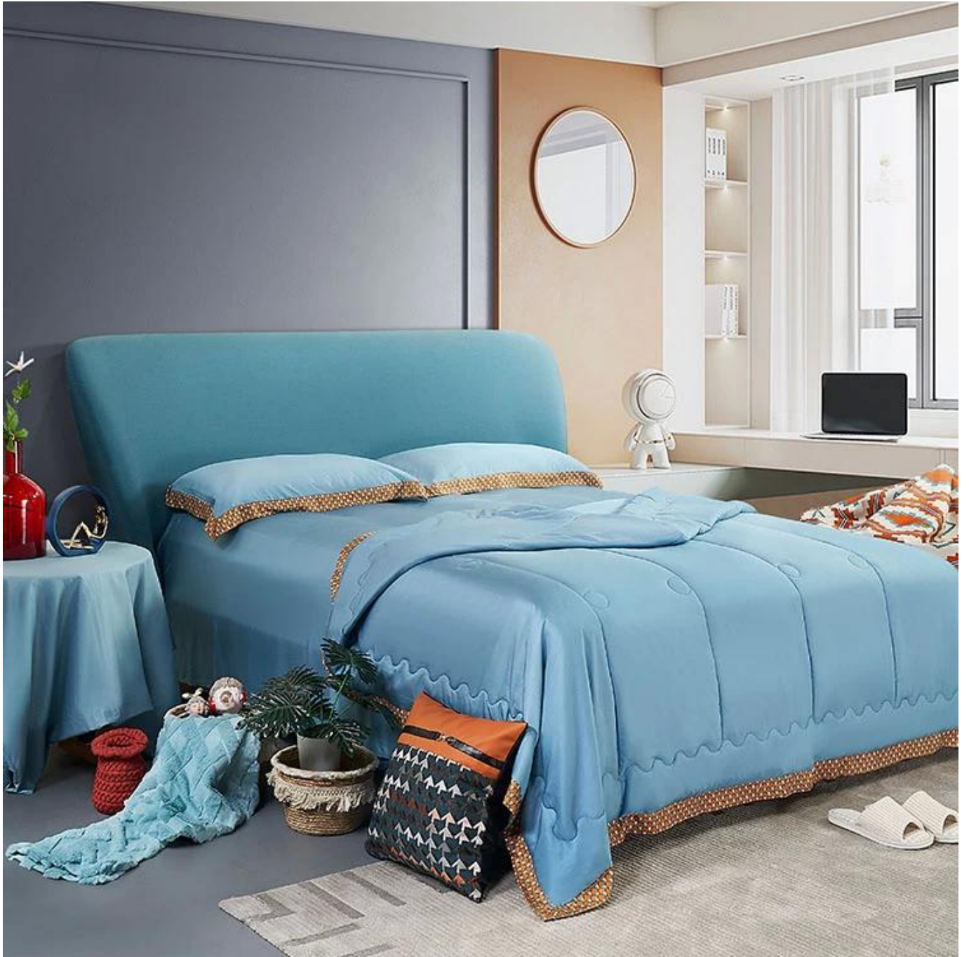
Exquisite Sommerdecke mit vier luxuriösen Farben