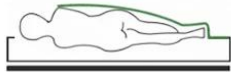
nicht flexibel oder zu dick