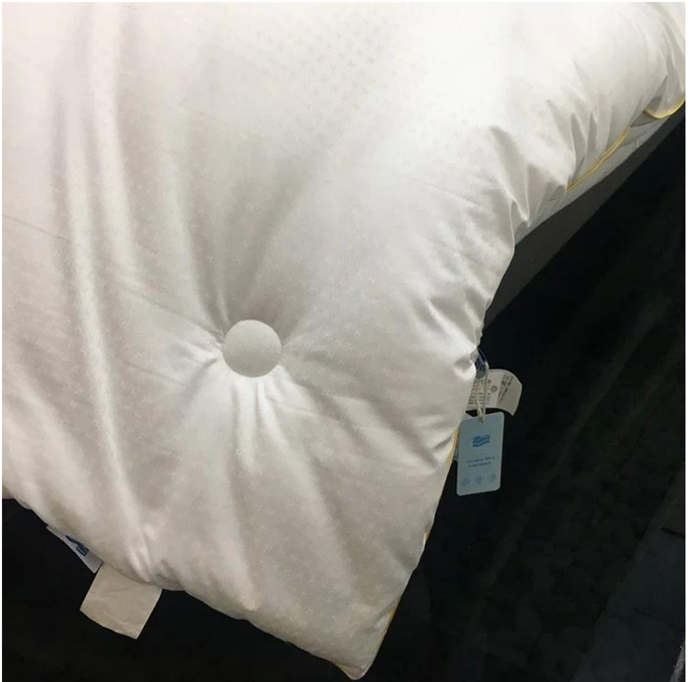
Flauschiges hochwertiges Hotelprodukt - weiche Hoteldecke