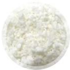
jungfräuliches Holz spinnen