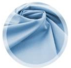
in Stoff einweben