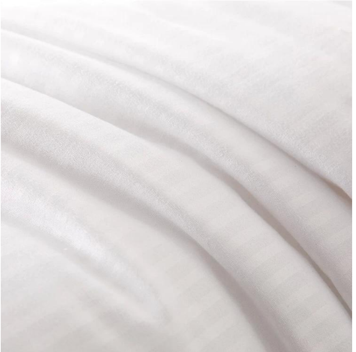
Betteinlage aus warmer Wolle (Wollfaser)