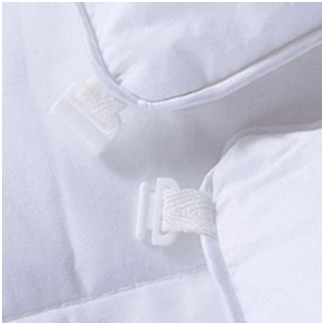
Edredón cálido dos en uno