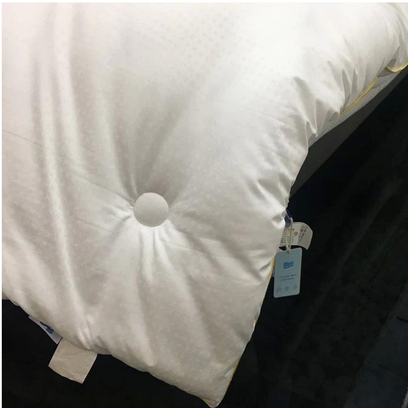
Producto de ropa de cama de hospitalidad de clase alta esponjosa: edredón de hotel suave