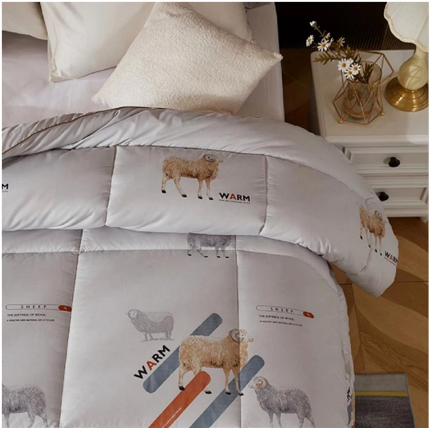
Costura de ovejas destacadas