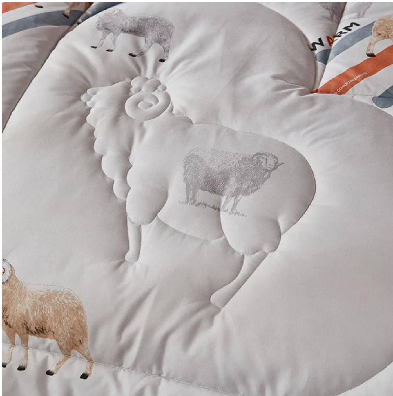
Bandas de anclaje mejoradas