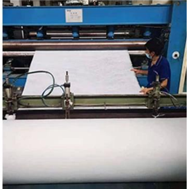
Atelier de courtepoinde / produits de literie