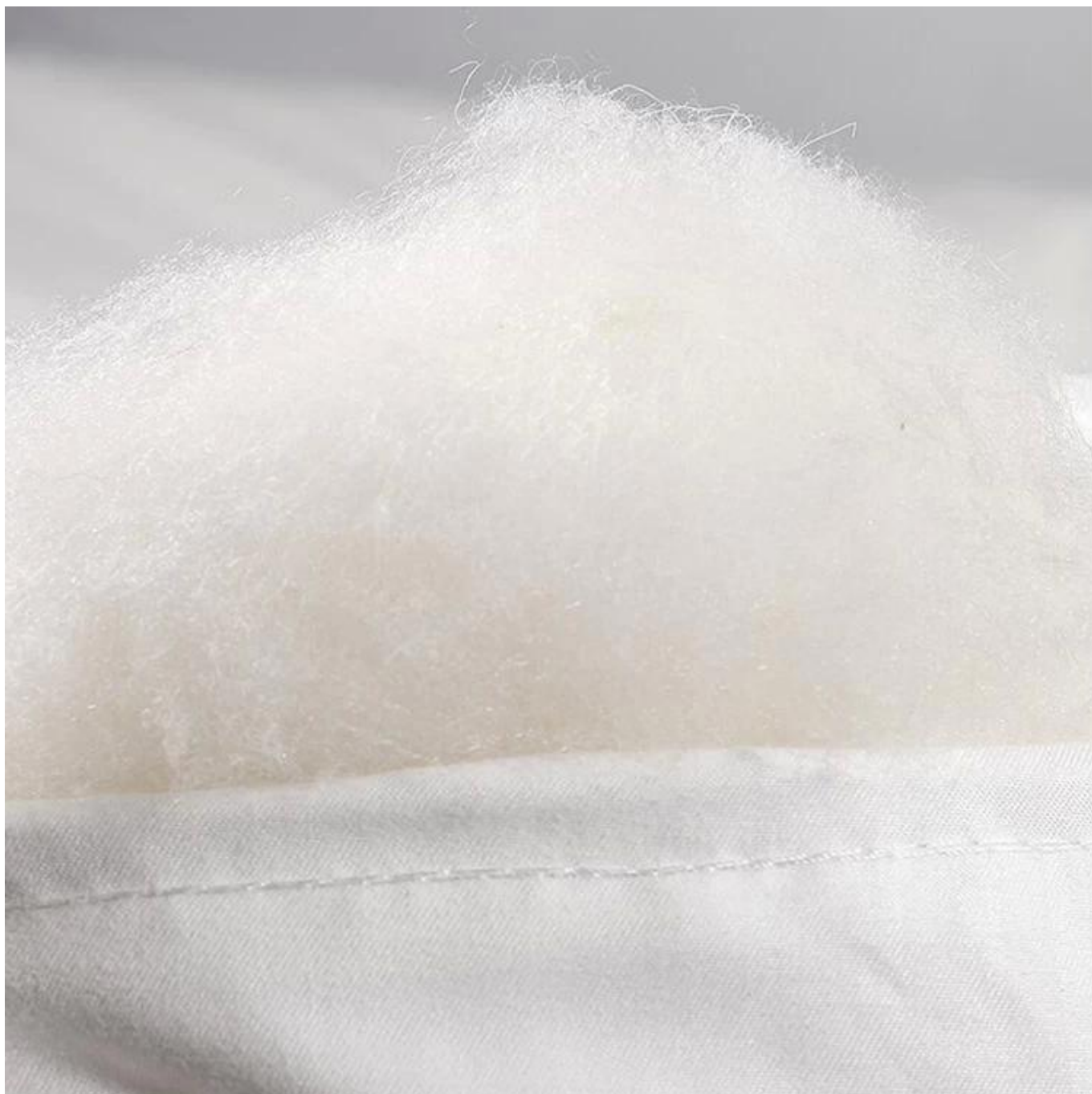
Surface semblable à un nuage