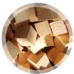
matériau en bois de hêtre