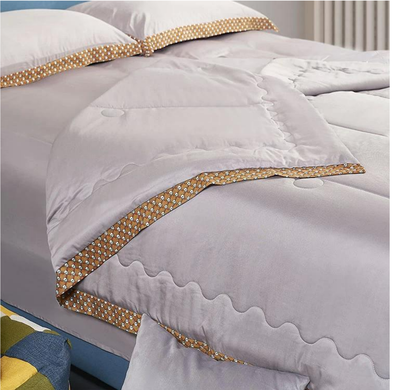
Remplissage de fibres en spirale 3D