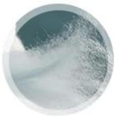
extraire la fibre