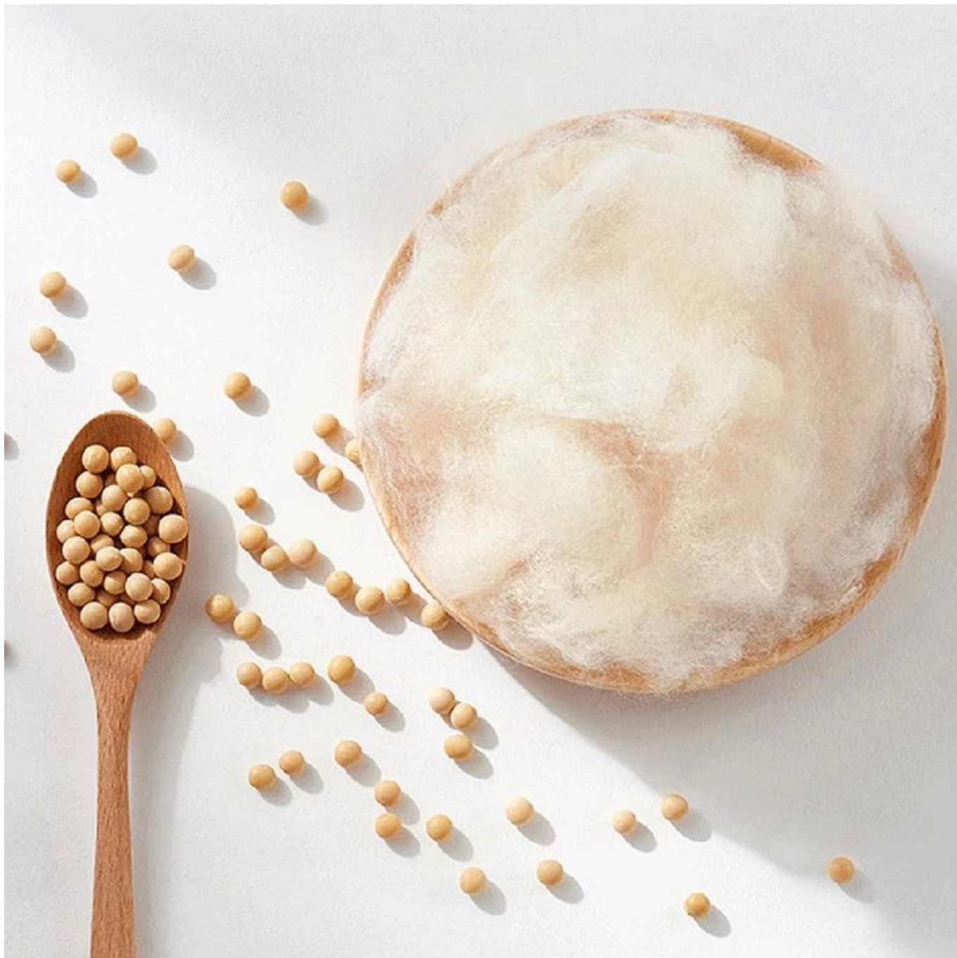
Processus matelassé spécial