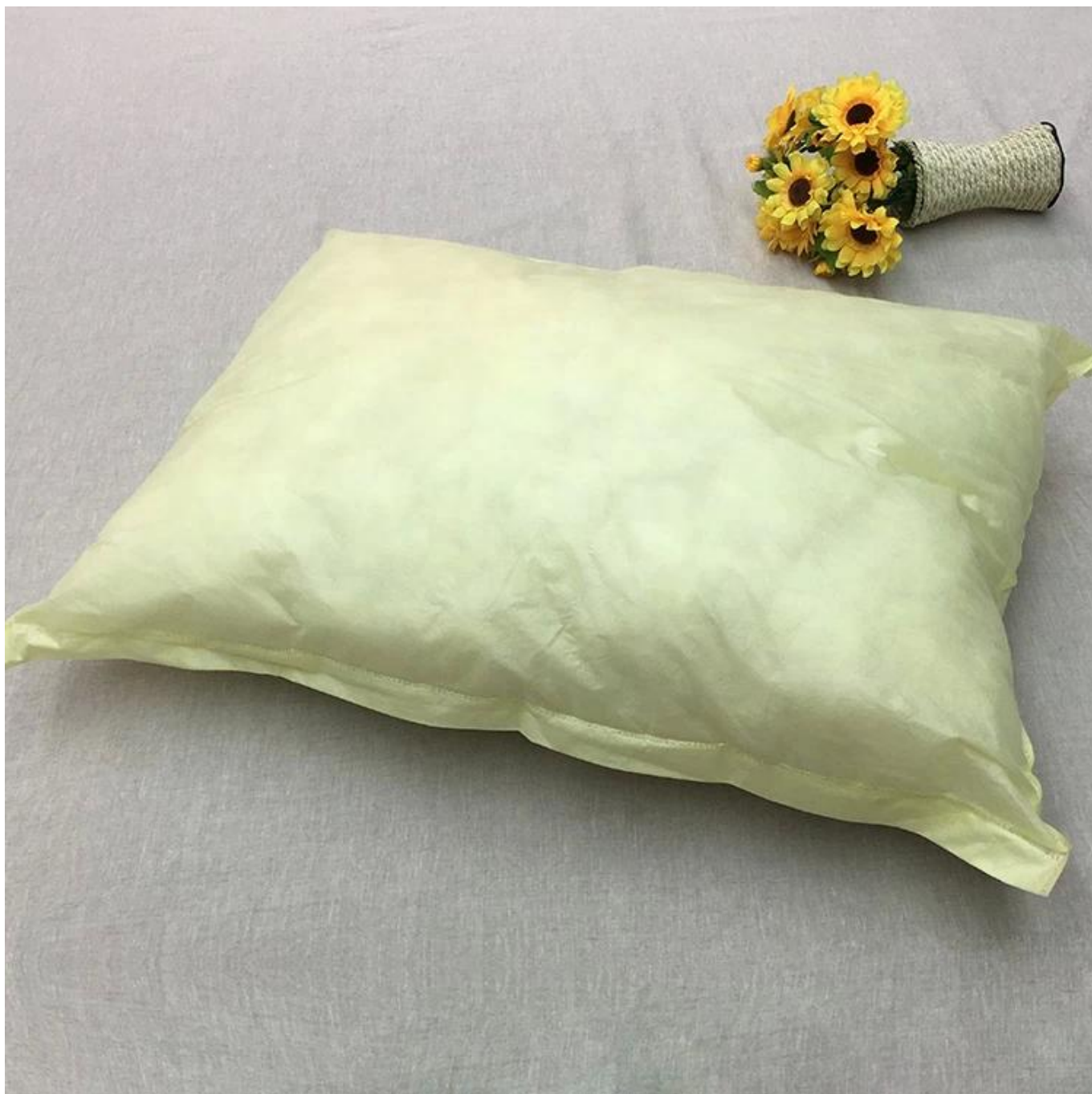
Remplissage de fibres en spirale 3D