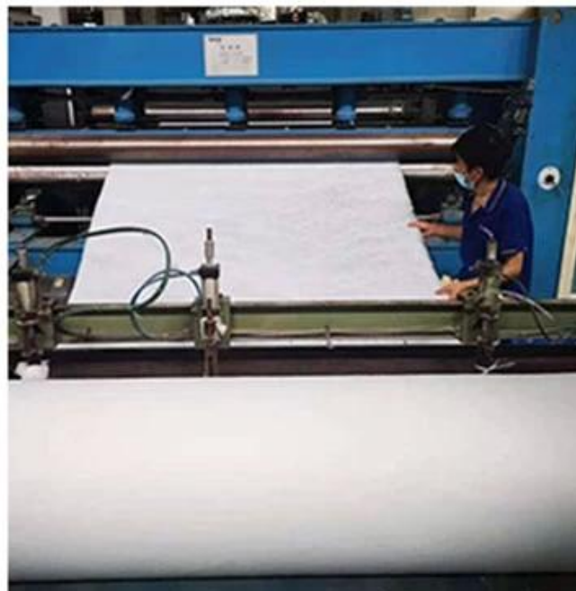
Atelier de produits de courtepoinde / literie