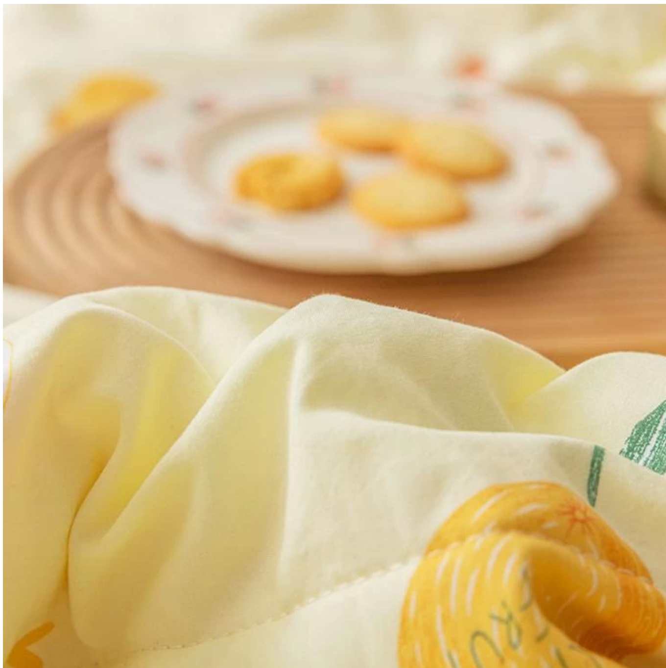
Remplissage de fibres en spirale 3D