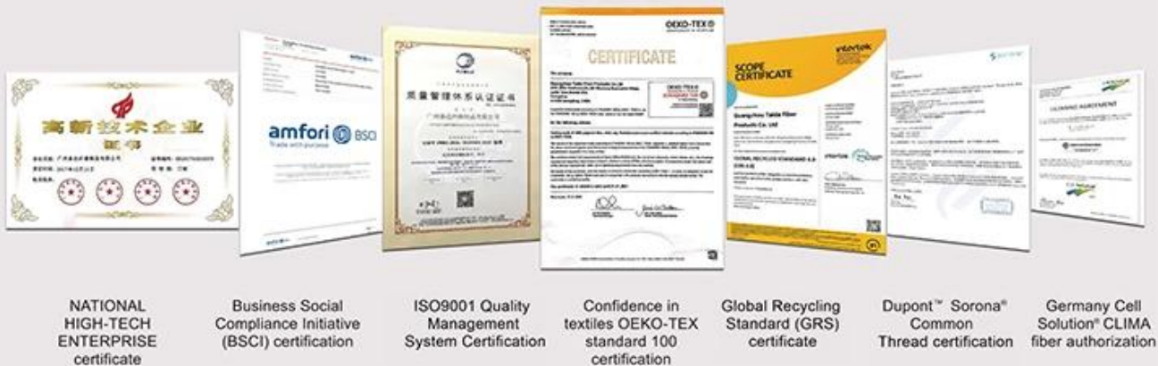
NATIONAL HIGH-TECH ENTERPRISE certificate