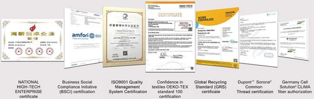
NATIONAL HIGH-TECH ENTERPRISE certificate