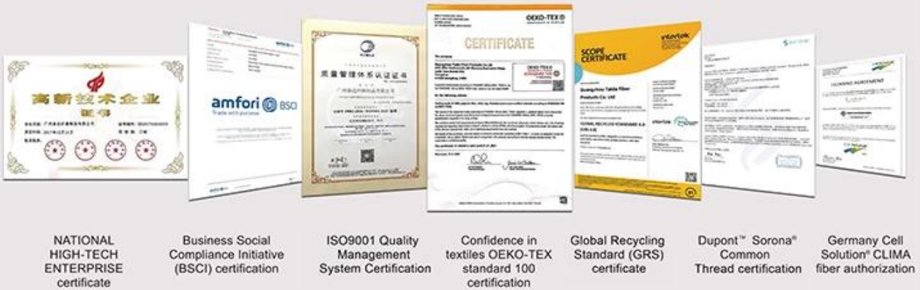
NATIONAL HIGH-TECH ENTERPRISE certificate