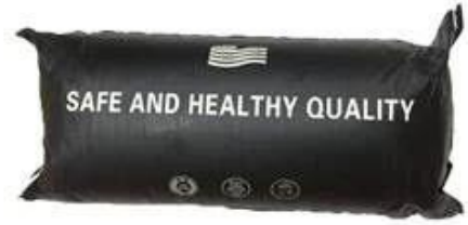
Express logo bag