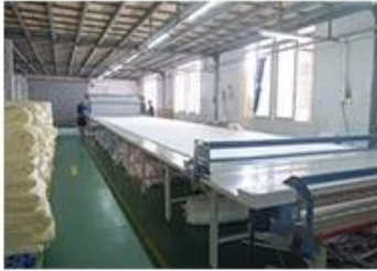
① Fabric inspection