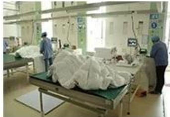
⑧ Product inspection