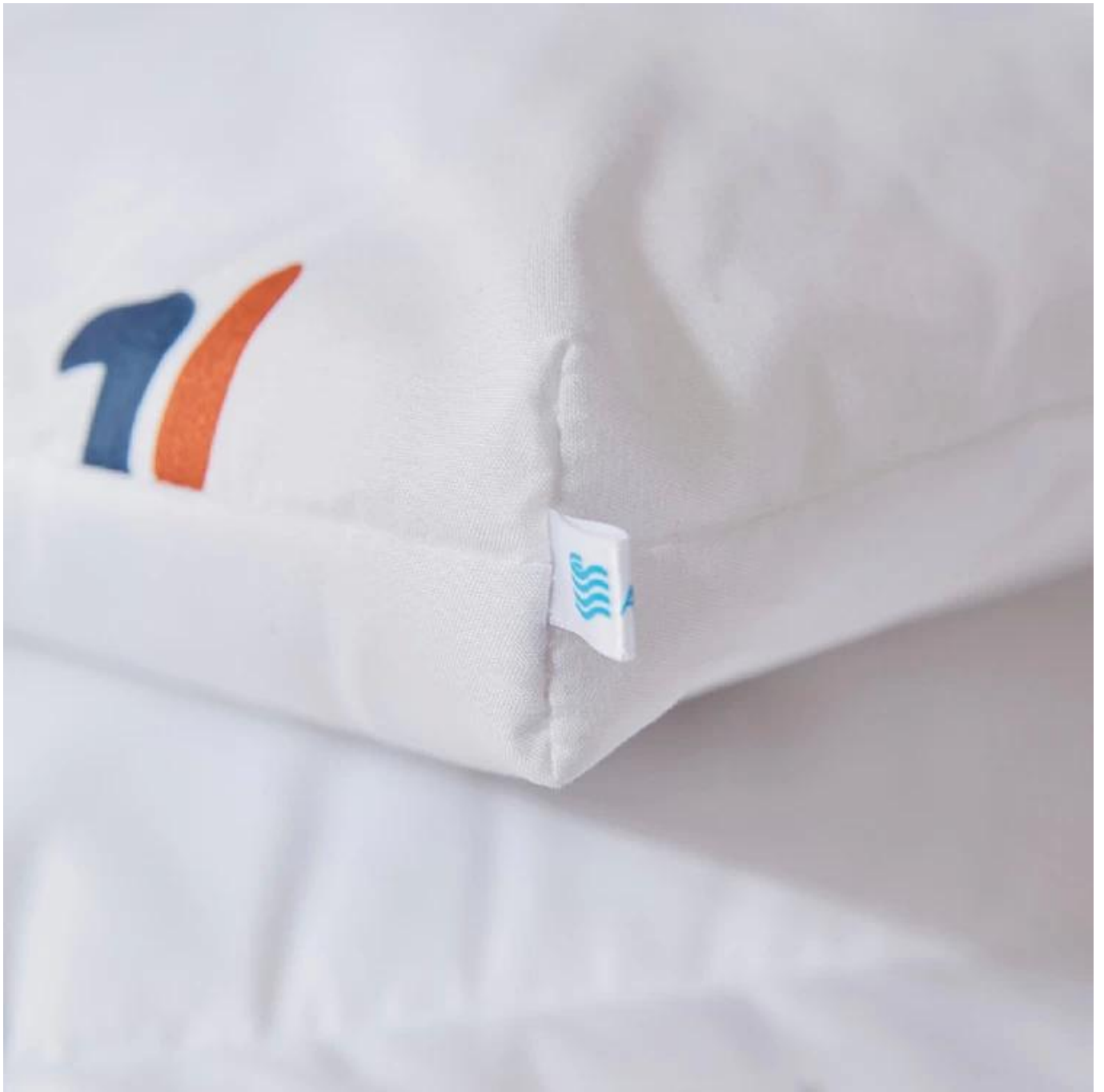
Label, Tanda & Tag