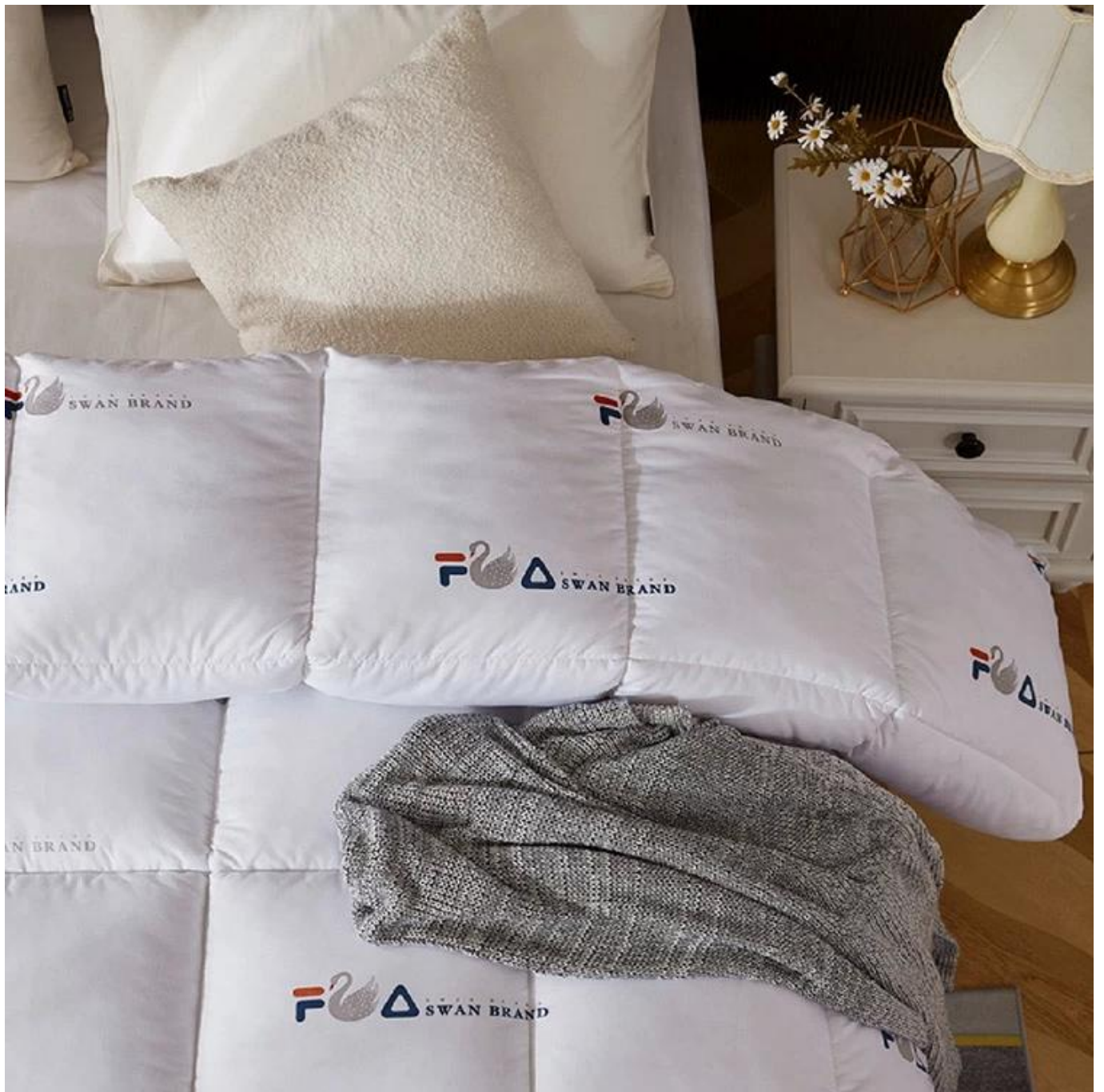
Kotak pilihan dijahit