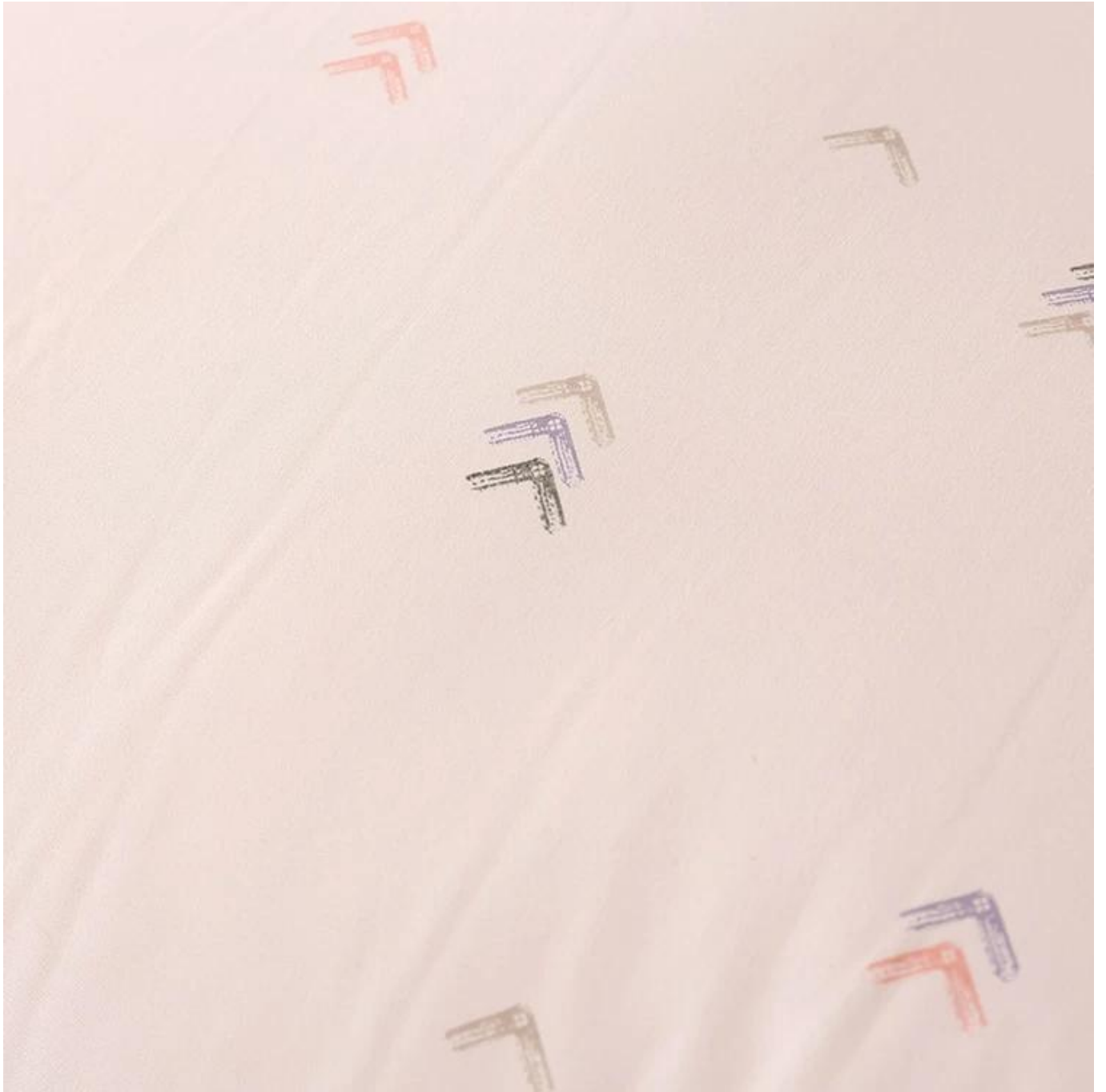
Sisipan Selimut Gentian Soya Suam