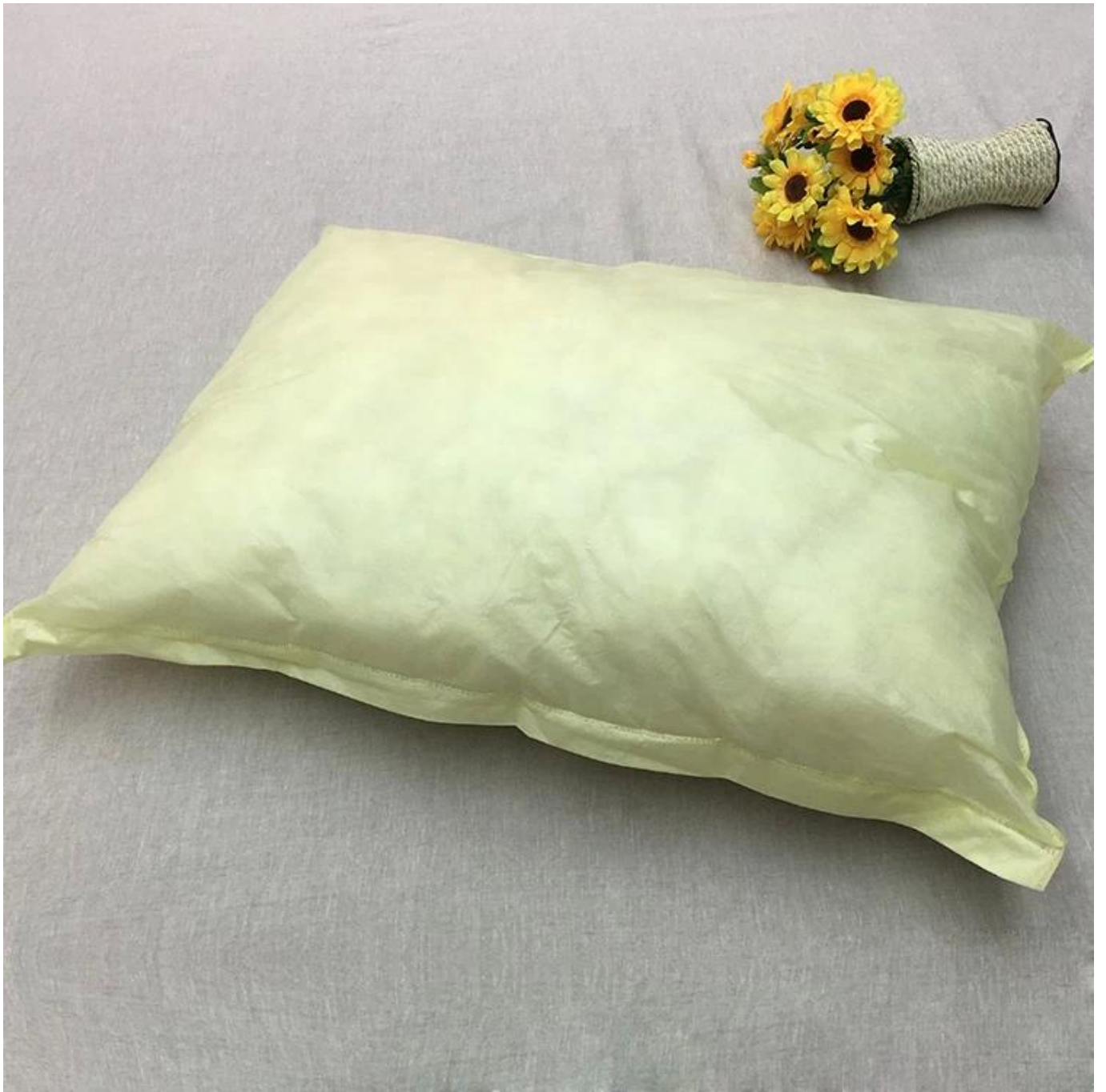
Pengisian gentian lingkaran 3D