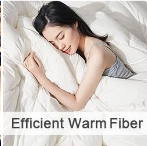
Efficient Warm Fiber

Sila hubungi kami untuk lebih banyak produk wadding serat!