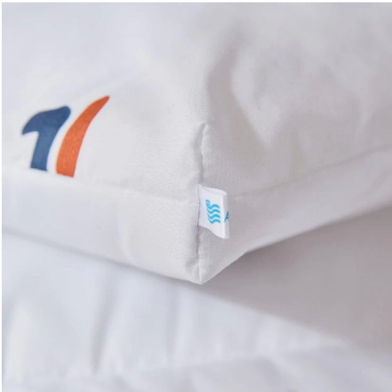
Label, Tanda & Tag