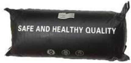
Express logo bag