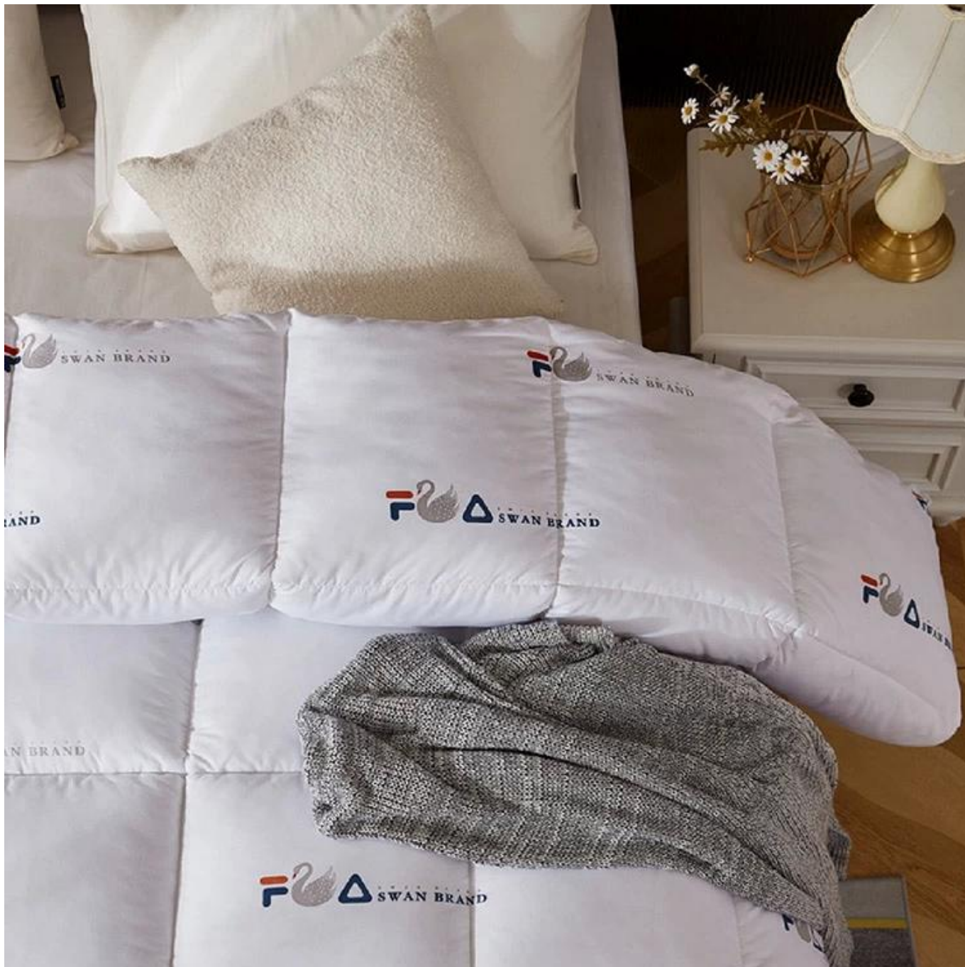
Caixa em destaque costurada