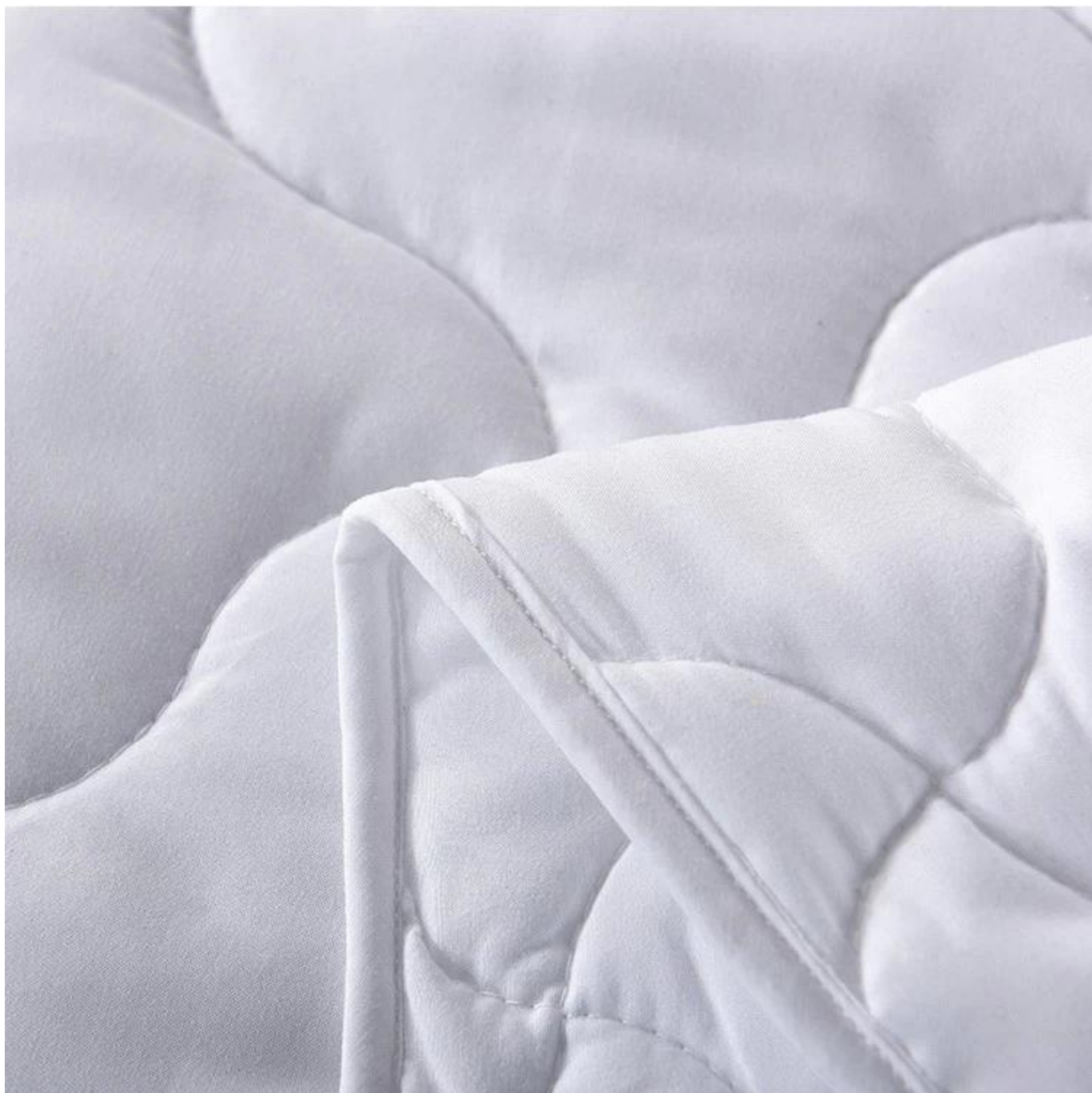
Design de banda elástica ao redor