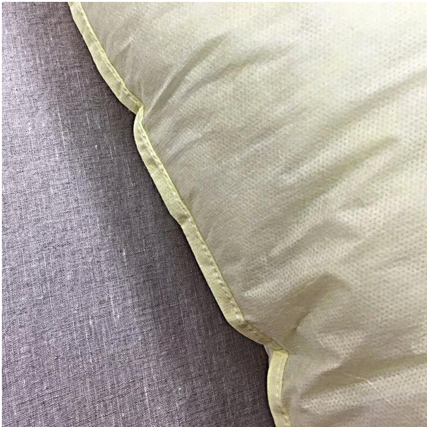
Processo de prensagem a quente requintado