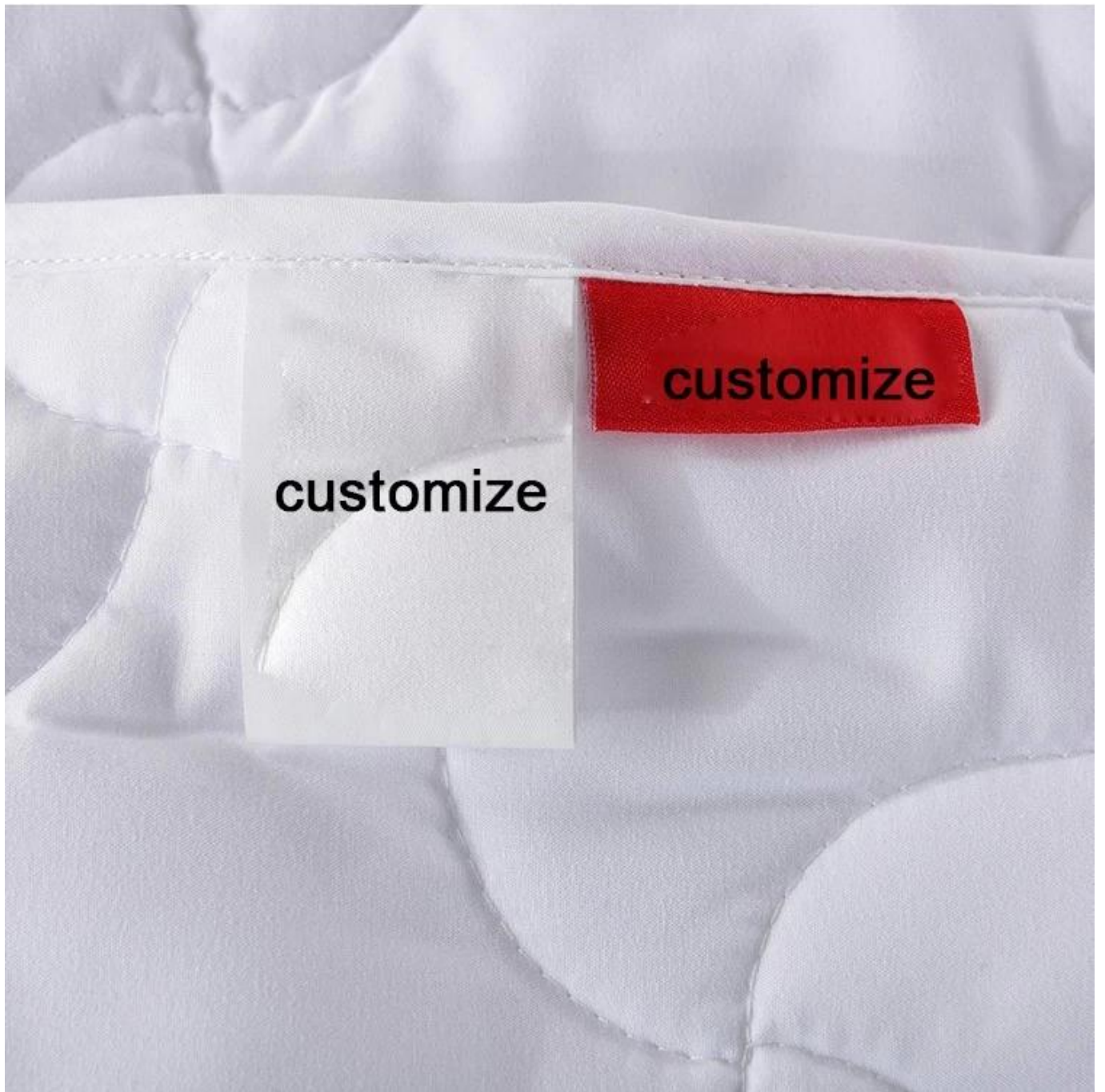
Requintada técnica de quilting