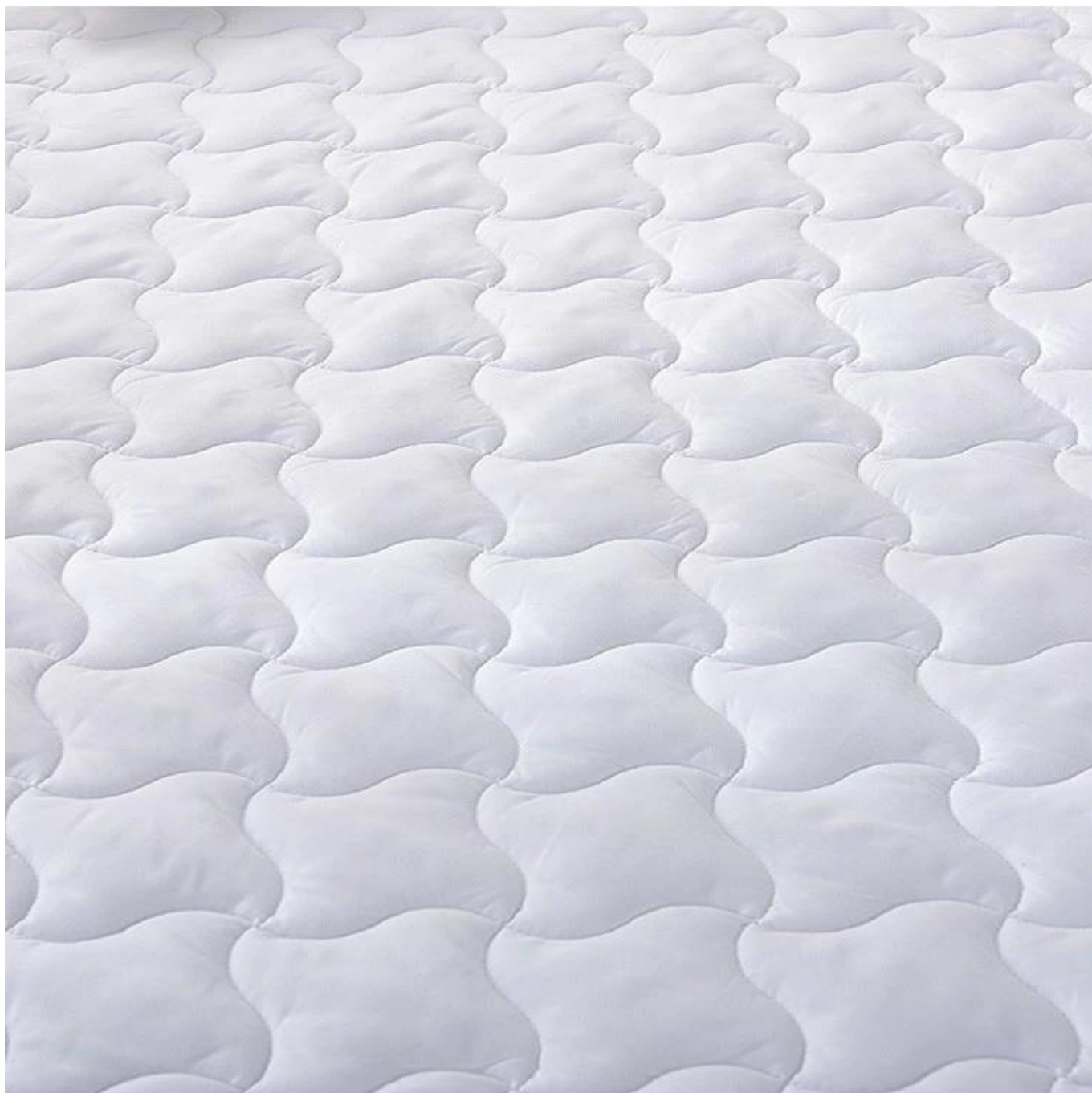
Enchimento de fibra espiral 3D