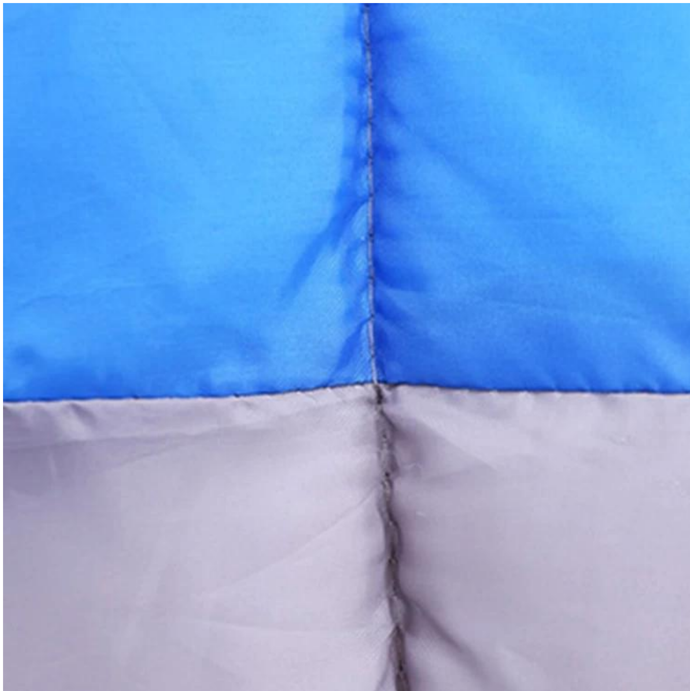
Zíper com controles deslizantes duplos