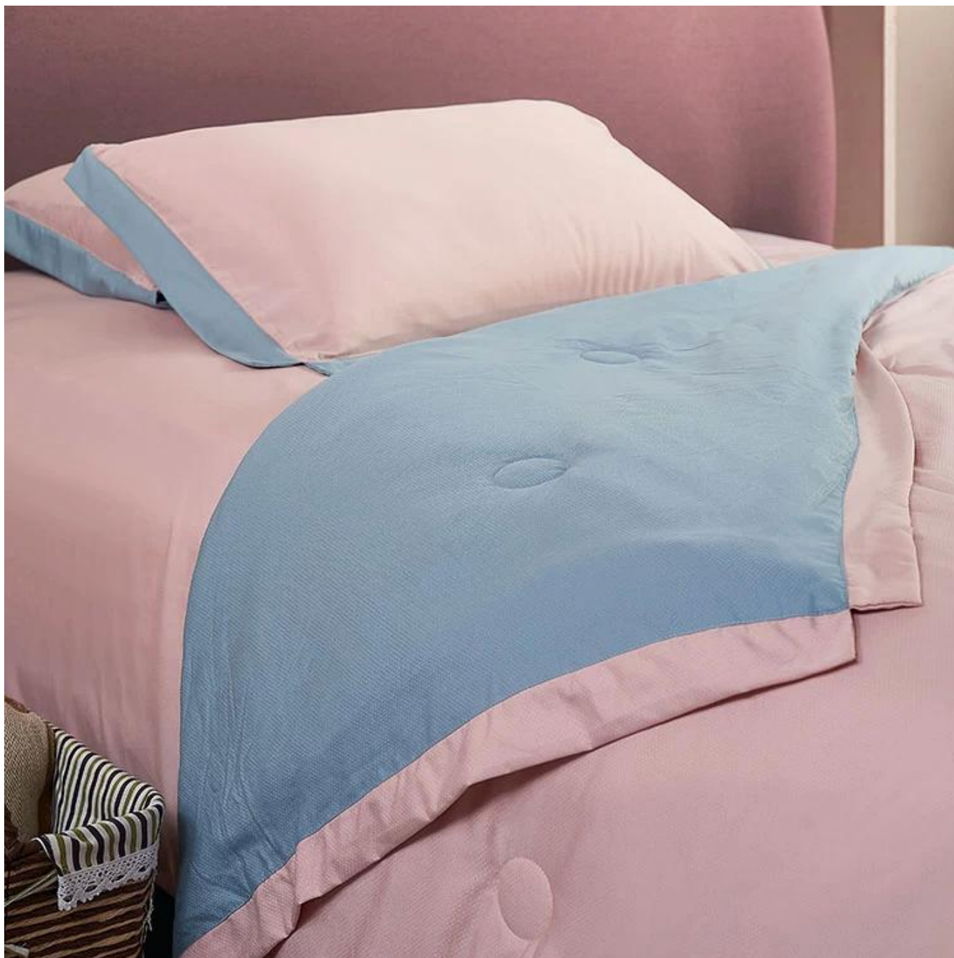
Enchimento de fibra espiral 3D