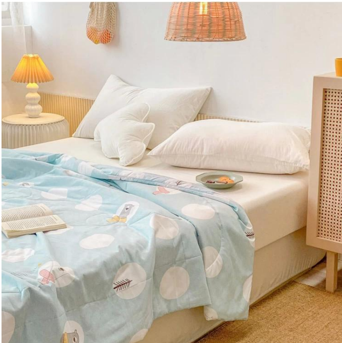
Enchimento de fibra espiral 3D