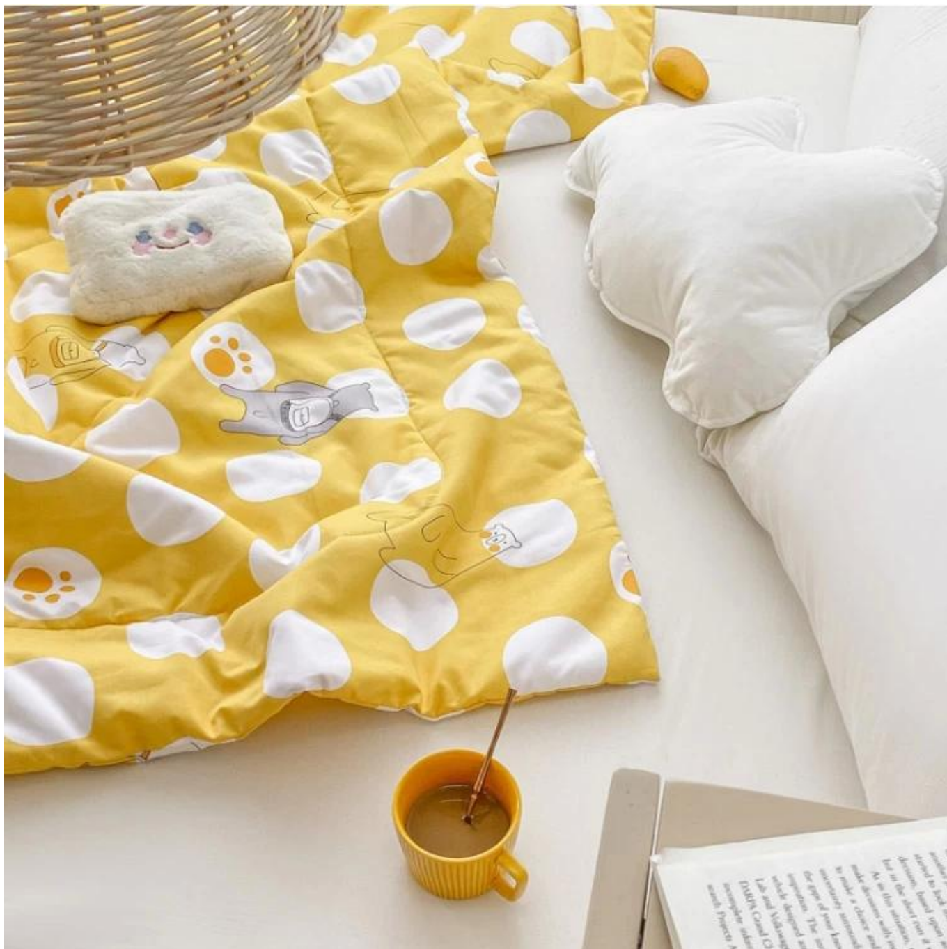
Enchimento de fibra espiral 3D