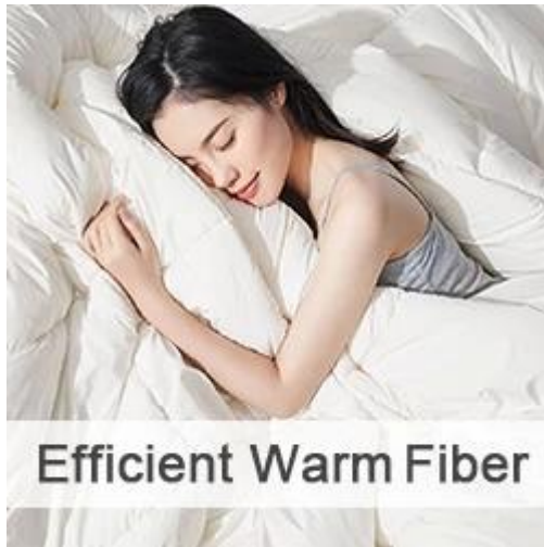
Efficient Warm Fiber

Entre em contato conosco para mais produtos de enchimento de fibra!