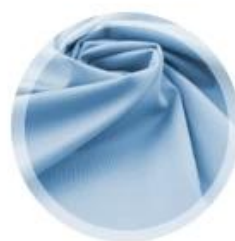
вплести в ткань