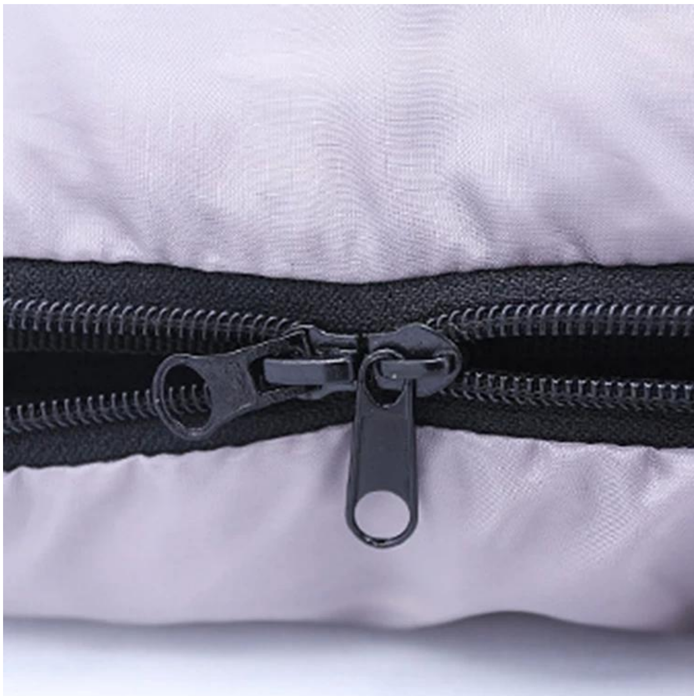
С нижняя молния, дышащий дизайн