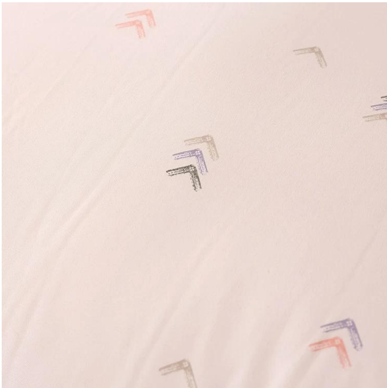
Теплая вставка из соевого волокна