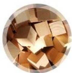
материал из бука