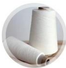
скрученный в пряжу