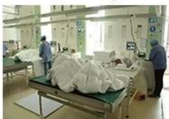
⑧ Product inspection