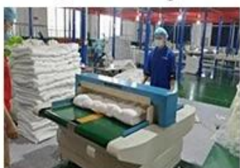
⑦ Needle detectors