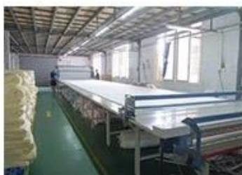
① Fabric inspection