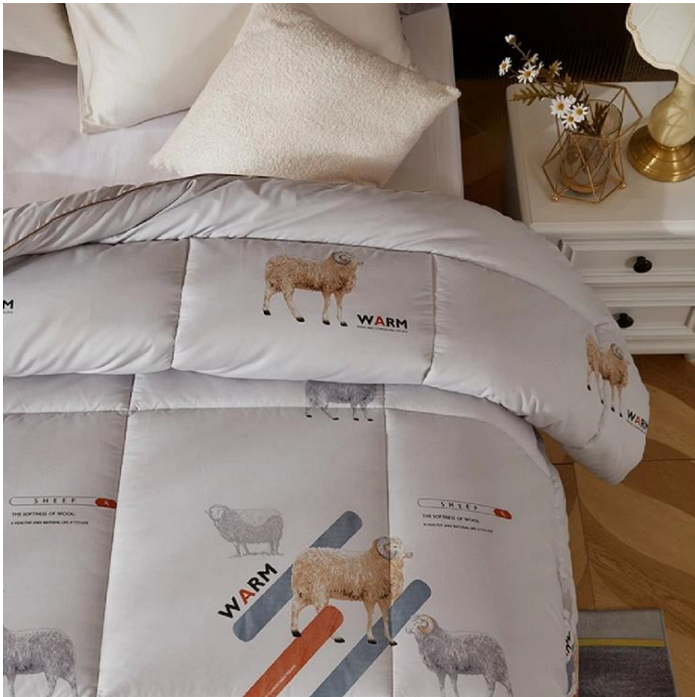
Рекомендуемые шитье овец